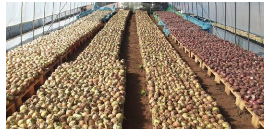
モデル農園の様子