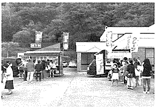
キッチンカー大集合